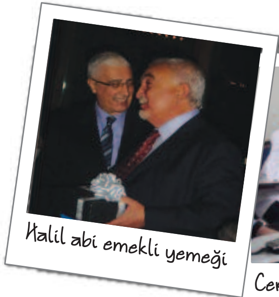
Kalil abi emekli yemeği

İnsan sevdiği işi yapmalı. Ben bu işi seviyorum.