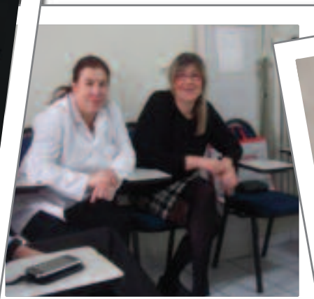
Cerrahi kızlar ekibimiz