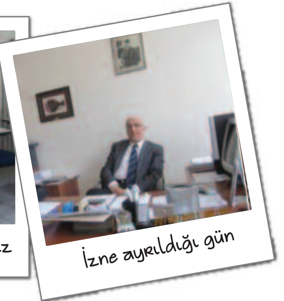
İzne ayrıldığı gün